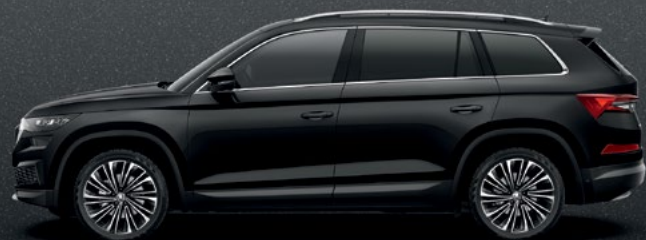
Magic Black metallikvärv