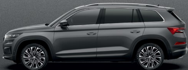
Graphite Grey metallikvärv