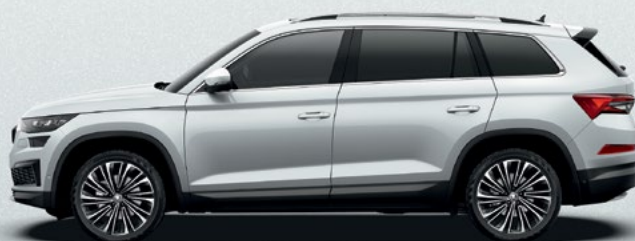
Moon White metallikvärv