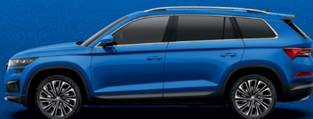
Race Blue metallikvärv