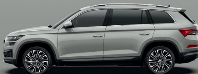
Steel Grey tavavärv