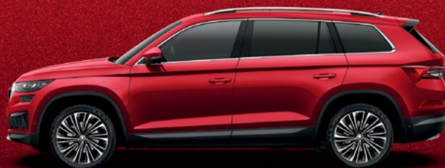
Velvet Red metallikvärv