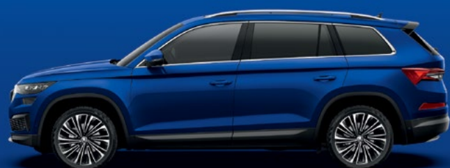
Energy Blue tavavärv