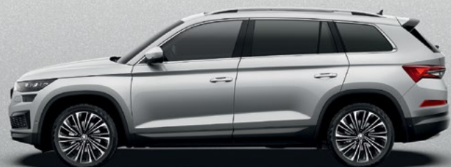
Brilliant Silver metallikvärv