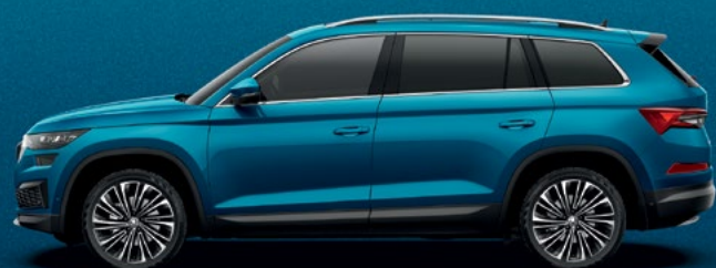
Lava Blue metallikvärv